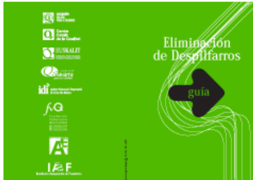
“Eliminación de despilfarros”