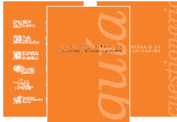
“Cuestionarios de autoevaluación”