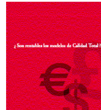
“Estudios sobre la rentabilidad de los modelos de calidad”