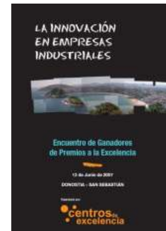
“La innovación en empresas industriales”