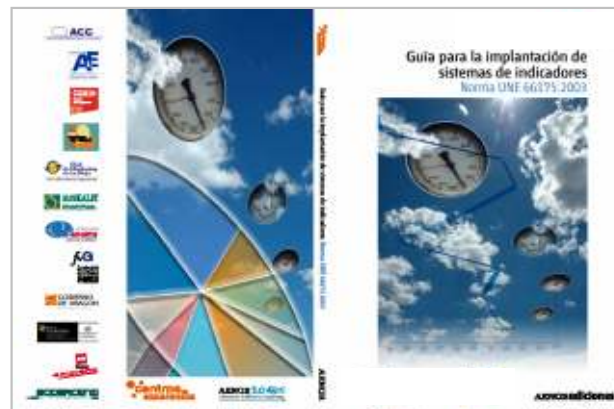
“Sistemas de indicadores”