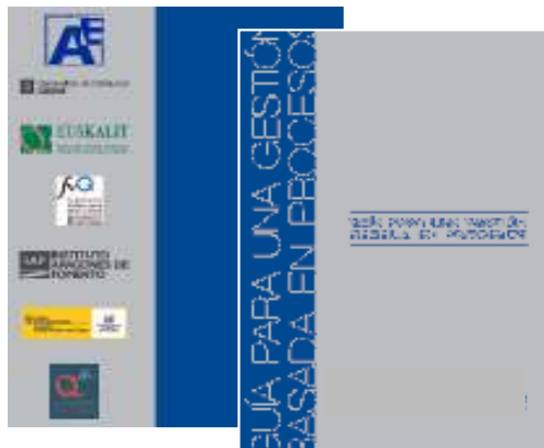
“Gestión basada en procesos”